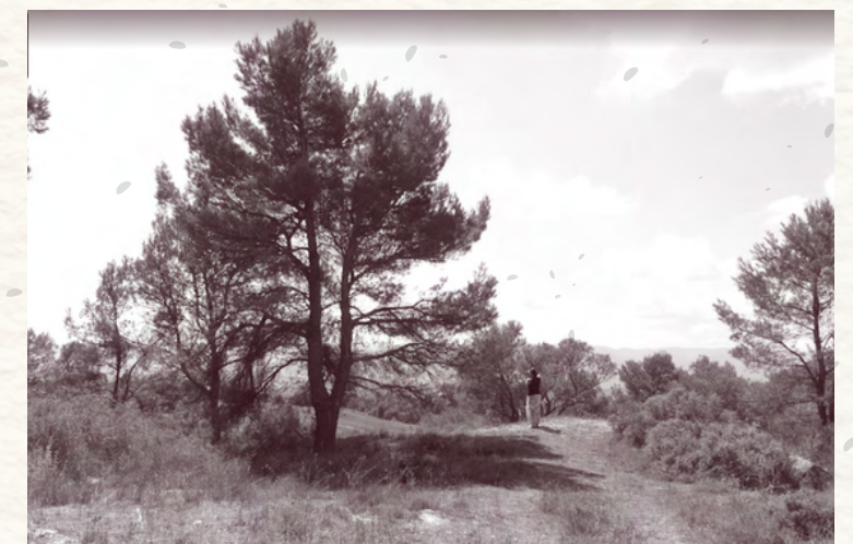
8. Instal·lació integració paisatge