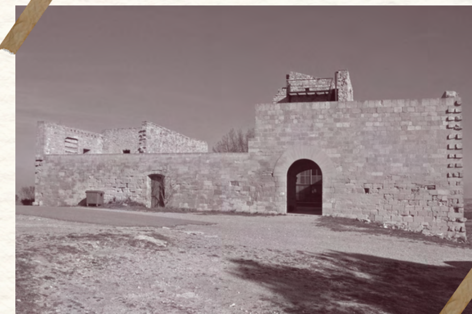
Santuari del Tallat Recinte del s.XII