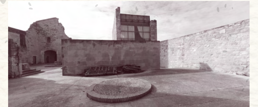
4 - 5. Pati interior - Instal·lacions