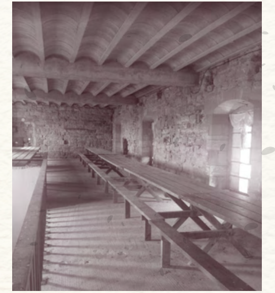
2. Sala d'instal·lacions